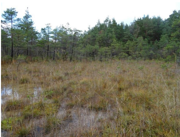
Foto 10. Allikasoo Rumpo poolsaarel

Inventeeriti esmakordselt. Metsa servast väljuvad allikanired koonduvad allpool suureks veelaks. Allikasoole iseloomulikult domineerivad siin soontaimedest pruun sepsikas ja lubikas. Hõredalt kasvab pilliroog ning siin-seal kuni 50 cm kõrgused männid. Kohati võis näha pääsusilma ( Primula farinosa ) ja soo-neiuvaipa. Sammaldest olid domineerivateks liikideks täht-kuldsammal ( Campylium stellatum ) ja tava skorpionsammal. Allikasoodele iseloomulikult sadeneb siin-seal lupja, kuid nõrglubja-allikatele iseloomulike samblaliike ei leitud.