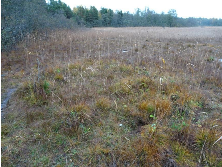
Foto 8. Vormsi Raviallikas.

saarel. Huvitavaks leiuks selle allika ümbruses oli pudel-põisik ( Splachnum ampullaceum ). Nimetatud liik kasvab loomade sõnnikul ja viitab samuti sellele, et sammalde liigirikkuse suurendamiseks on oluline loomade olemasolu taimekooslustes.