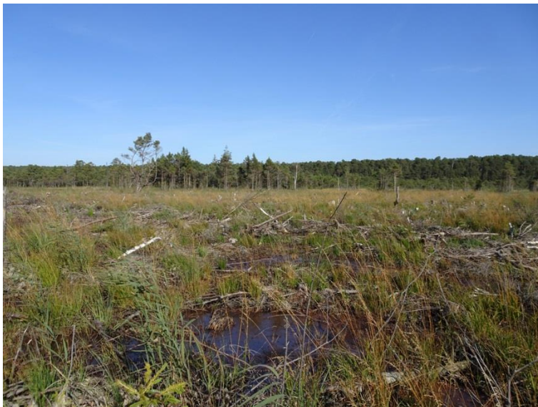
Foto 11. Sutru taastatav soola

Aladel registreeriti kokku 41 liiki (Tabel 3). Suhteliselt liigirikkad, kuid väga väikese sammalde katvusega olid taastatud soolad ja soometsas paiknev ala. Sammalde katvus oli siin ainult mõni protsent, vaid taastamisalal oli ühe ruudu katvus 40% (see koosnes palusamblast, mis oli ilmselt raiel jäänud juhuslikult puutumatuks). Kahel taastataval alal ning metsa-alal oli üldine liigirikkus 15 liiki, ühel taastataval alal 6 liiki. Erilisi dominantliike ei esinenud. Taastatavatel aladel esines nii metsa-, soo- kui juhuslikke avakoosluste liike. Märkimisväärne on haruldase liigi laiuva mütshellikukese ( Physcomitrella patens ) esinemine kahel taastataval soolal. Metsa-alal leidis tavalisi metsa- ja soosamblaid.