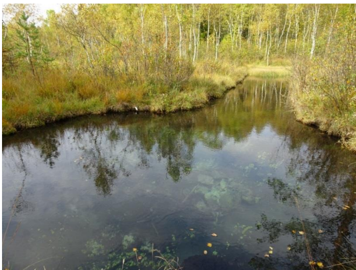
Foto 4. Kiigumõisa allikas piirkonnas 4.

inventeeriti kordusena. Taimestik on endise ilmega. Soontaimedest on endiselt ohtraimad sinihelmikas ja harilik lubikas. Kohati esineb pruun sepsikas ( Schoenus ferrugineus ), ääristarn ( Carex hostiana ) ja soo-neiuvaip ( Epipactis palustris ). Sammaldest domineerib teravtipp. Ohtramalt esines sõnajalg nõörsammal, registreeriti ka sirp-roodik ( Palustriella falcata ) ja tava-skorpionsammal ( Scorpidium cossonii ).