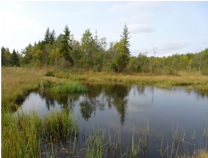
Foto 5. Kiigumõisa allikas piirkonnas 5.

Selles piirkonnas teostati samuti kordusinventeerimine ja siingi ei täheldatud erilisi muutusi. Ohtralt esineb sinihelmikat ja tarnu, vees on sage läikviljane luga ( Juncus articulatus ). Sammaldest domineerib endiselt teravtipp, kohati tava-skorpionsammal ja harilik skorpionsammal. Leidub nii sõnajalg nõorsammalt kui sirp-roodikut.