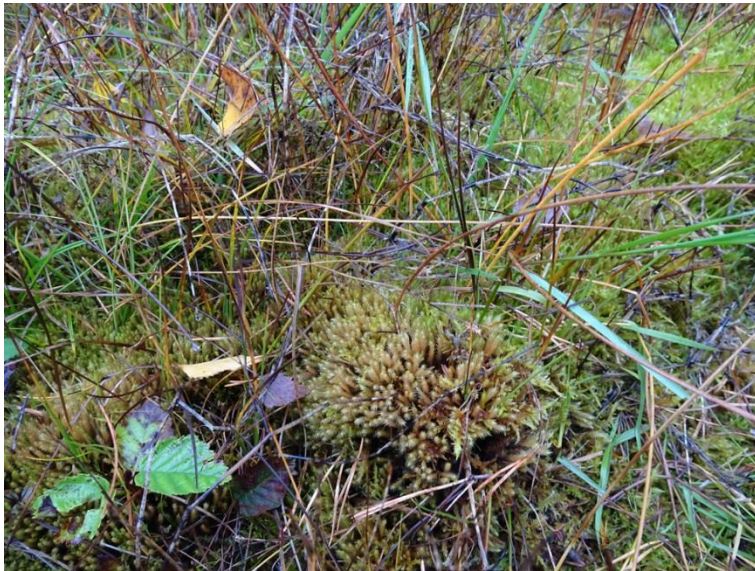
Foto 7. Lubi-allikasambla mättad aiaga ümbritsetud lubjakünkal.

( Philonotis calcarea ), mis moodustas suuri mättaid, võsude pikkusega kuni 15 sentimeetrit. Teise dominandina esines tava-skorpionsammal (seda liiki polnud eelnevalt siit registreeritud). Üldine liigirikkus oli enam-vähem samaks jäänud. Elupaiga tunnusliikidest oli endiselt olemas sirp-roodik, aga kaunis skorpionsammal ( Scorpidium revolvens ) oli asendunud tava-skorpionsamblaga. Aia sisse jäänud ala oli võimsalt kattunud sammaldega, kuid kuna samblavaip koosnes peamiselt vaid paarist liigist, võib arvata, et dominantsamblad hakkavad teisi välja suruma ning pikemas perspektiivis võib toimuda liigirikkuse vähenemine. Lisaks on arvata, et kiiresti kasvavate sammalde all hakkavad toimuma turvastumise protsessid. Seega võib väita, et loomade poolt tekitatud mõõdukad häiringud võivad takistada turvastumist ning soosivad sammalde liigirikkust.