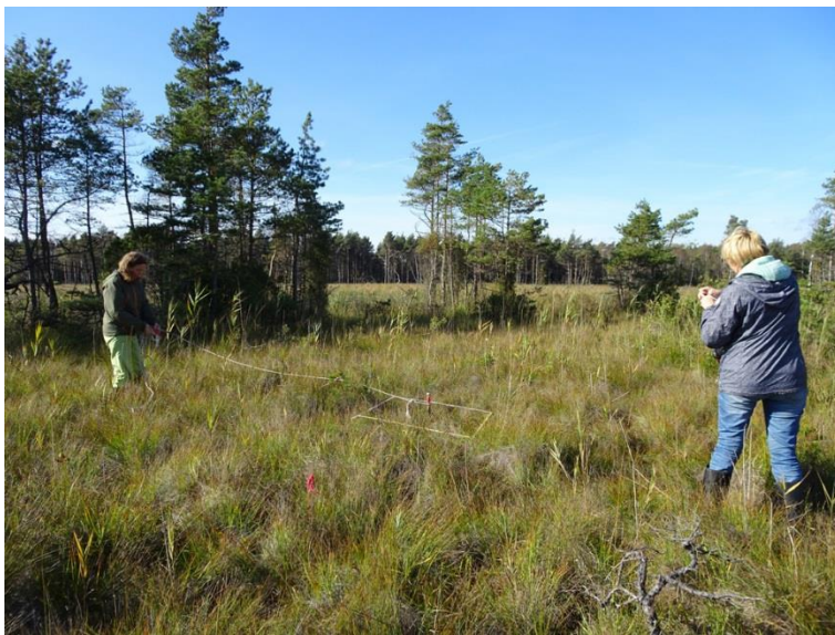
Foto 13. Sutru looduslik soo ala

Looduslikud soolad olid suurema katvusega (6% ja 23%), kuid pisut vähema liigirikkusega (vastavalt 9 ja 8 liiki). Siin domineerisid kohati täht-kuldsammal, kähar sulgsammal ( Ctenidium molluscum ) ja harilik skorpionsammal. Märkimist väärib allikasoodete iseloomuliku Bantri nokissambla ( Mesoptychia bantriensis ) esinemine ühes püsiruudus ning lubjarikastele madalsoodete iseloomuliku hariliku skorpionsambla esinemine vaid siin, samuti iseloomustab looduslikku soola suurem helviksammalde liigirikkus.