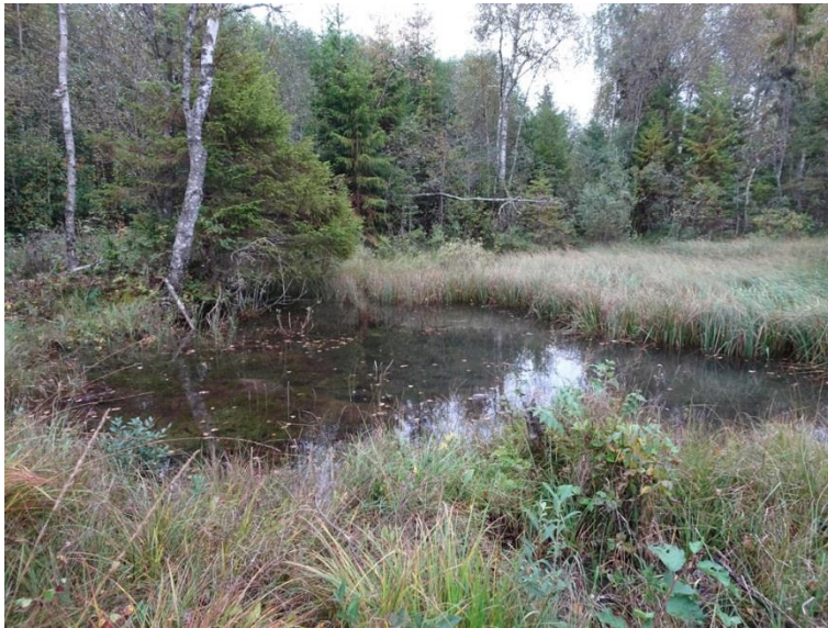
Foto 2. Kiiguõisa allikas 2

harilik lubikas, harilik peetriteht ( Succisa pratensis ), harilik varsakabi ( Caltha palustris ), soopihl ( Potentilla palustris ) ja sinihelmikas. Sammaldest on allika kallastel ohtralt teravtippu, teda leidub ka roostepruuni pudeva kihiga kaetuna vee sees. Veēs esineb mändvetikat ( Chara sp.). Lupja setitada võivatest samblaliikidest registreeriti allika ümbruses sõnajalg-nöörsammal ja harilik skorpionsammal ( Scorpidium scorpioides ).