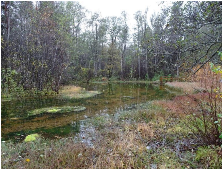
Foto 6. Vormsi Suurallikas.

Suurallika ümbruse taimestik ei ole kolme aastaga toimunud olulisi muutusi liigirikkuses ja dominantsete liikide nimekirjas. Endiselt olid sammaltaimede hulgas domineerivateks liikideks kaldaäärses vees teravtipp ja suur tõmptipp ( Calliargon giganteum ), vees ka harilik vesisammal ( Fontinalis antipyretica ). Ohtralt esines seekord tava- skorpionsammal. Lupja setitada võivatest liikidest olid endiselt vähesel määral esindatud sõnajalg-nöörsammal ja tava-scorpionsammal.