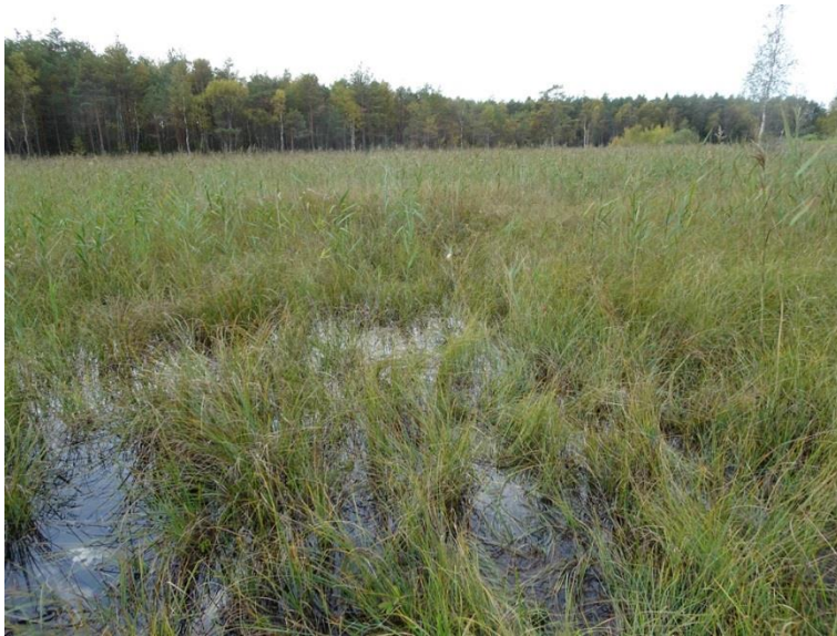
Foto 3. Kiigumõisa allikaline ala 3.