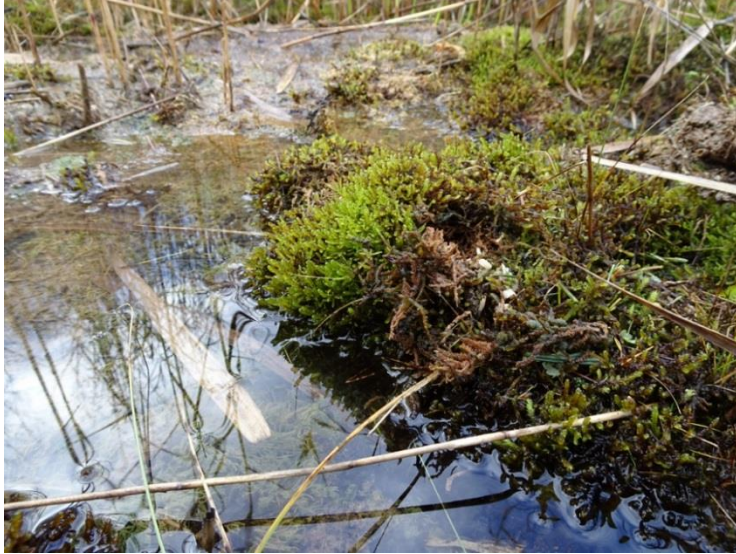
Foto 9. Tava skorpionsammal Raviiallika läheduses oleva allika alal.