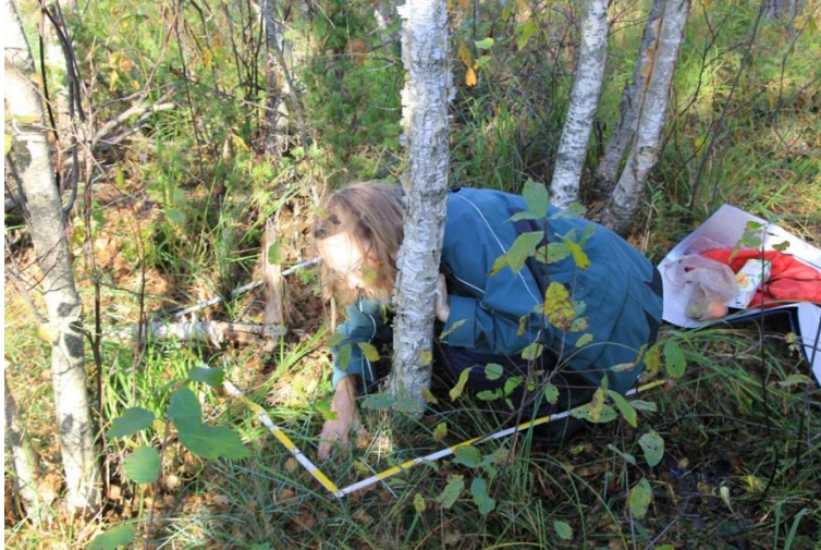
Foto 12. Sutru soometsa ala

Looduslikud soolad olid suurema katvusega (6% ja 23%), kuid pisut vähema liigirikkusega (vastavalt 9 ja 8 liiki). Siin domineerisid kohati täht-kuldsammal, kähar sulgsammal ( Ctenidium molluscum ) ja harilik skorpionsammal. Märkimist väärib allikasoodete iseloomuliku Bantri nokissambla ( Mesoptychia bantriensis ) esinemine ühes püsiruudus ning lubjarikastele madalsoodete iseloomuliku hariliku skorpionsambla esinemine vaid siin, samuti iseloomustab looduslikku soola suurem helviksammalde liigirikkus.